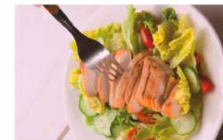
케이준 치킨 샐러드 Cajun Chicken Salad ₩5,000