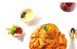
로제 파스타 Rosé pasta ₩7,000